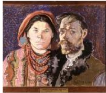
Stanisław Wyspiański, Autoportret z żoną, 1904 r.